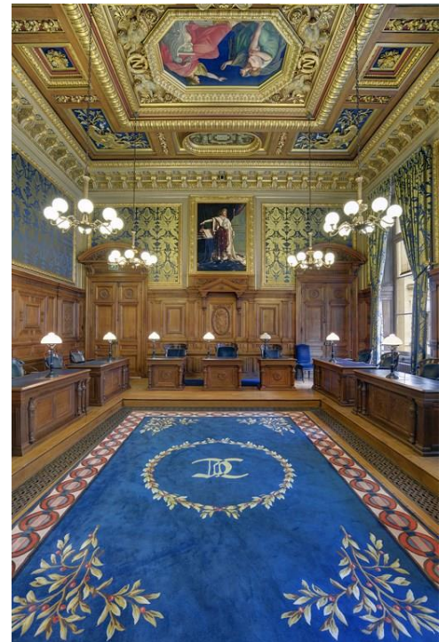
▲ Salle d'audience de la chambre commerciale, financière et économique de la Cour de cassation

C'est l'intérêt du présent arrêt. Dans l'arrêt de la cour d'appel de Paris examiné, cette juridiction avait validé le principe d'une telle clause tout en l'écartant en l'espèce au motif qu'elle était illisible, figurant en très petits caractères au dos du connaissement. Le pourvoi formé contre cet arrêt faisait essentiellement grief à la cour d'appel d'avoir fait application du droit français pour l'appréciation des conditions d'opposabilité de la clause et de n'avoir pas recherché si l'acceptation spéciale de la clause attributive de juridiction ne pouvait résulter de la stipulation habituelle de celle-ci au cours des relations d'affaires établies entretenues entre les parties ou d'un usage en matière de transport international de marchandises.